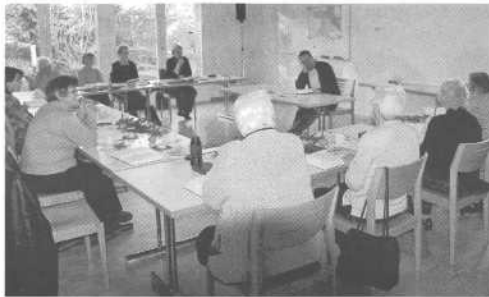
Bibelseminar: Texte lesen und darüber diskutieren

Die Lokalzeitung für das Tösstal ■ Amtliches Publikationsorgan der Gemeinden Schlatt, Turbenthal, Wila, Wildberg und Zell