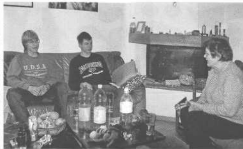
Ungezwungene Begegnung zwischen den Generationen